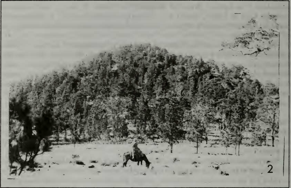
Fig. 2 El bosque de Pinus occidentalis sobre el Pico Duarte. Las cimas del Pico Duarte y Loma La Pelona están cubiertos por los árboles; no existe un paramó. Vista tomada desde el Vallecito de Lilís.